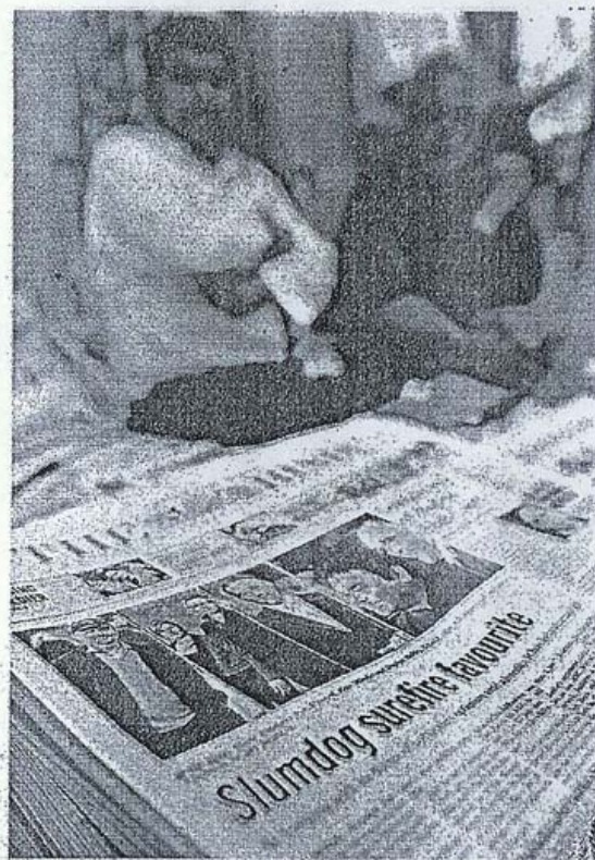
EN PRIMERA. Diarios indios dieron gran cobertura.

familia: un gran televisor de pantalla plana.