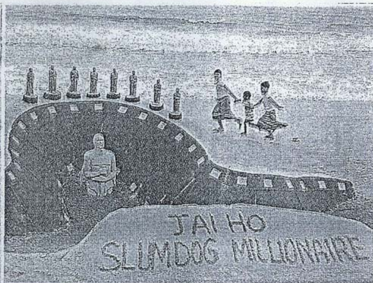
HOMENAJE. Una escultura de arena con las 8 estatuillas obtenidas.

★ FAMILIARES Y AMIGOS DE LAS ESTRELLAS INFANTILES DEL FILME DE DANNY BOYLE CELEBRARON EN LOS BARRIOS DE BOMBAY LA VICTORIA EN LA PREMIACIÓN DEL ÓSCAR